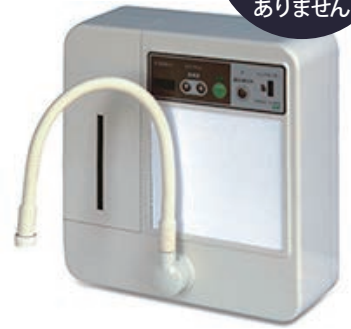
※写真はコア・クリーン 50